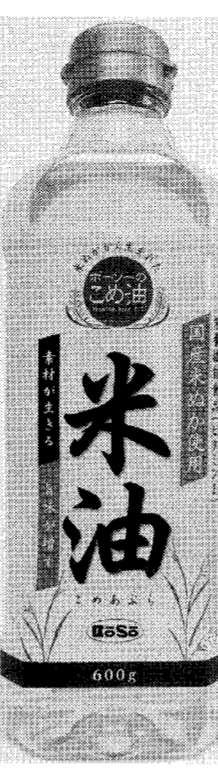
家庭用の基礎商品600gペットボトル。