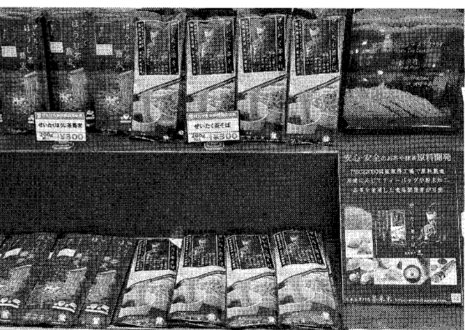
茶そば売り上げ1位の「ぜいたく茶そば」。

はたけなか製麺(株) 現在、数ある乾麺の中で売れ行きが好調な「ぜいたくほうじ茶蕎麦」を主力として展開中だ。同社は、北海道産の小麦と、長野県産のそばをブレンドし、独自の製法で製造している。北海道産の小麦は、たんぱく質が豊富で、グルテンが強い。長野県産のそばは、風味が良く、消化が良い。この2つをブレンドすることで、栄養価が高く、消化の良い乾麺を実現している。